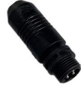
图 4 终止端