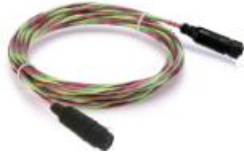
图 3 跳接线