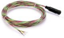
图 2 引出线